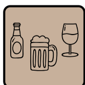
Birre e Bevande