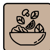
Piatti Freddi e Insalatone