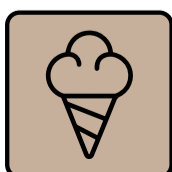
Dolci e Gelati